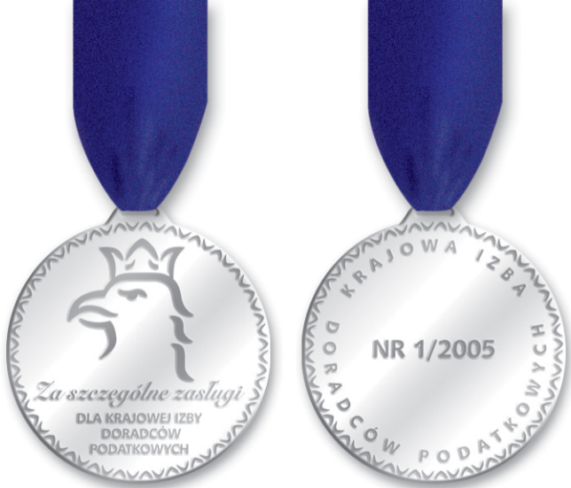
Medal średnica 4cm.